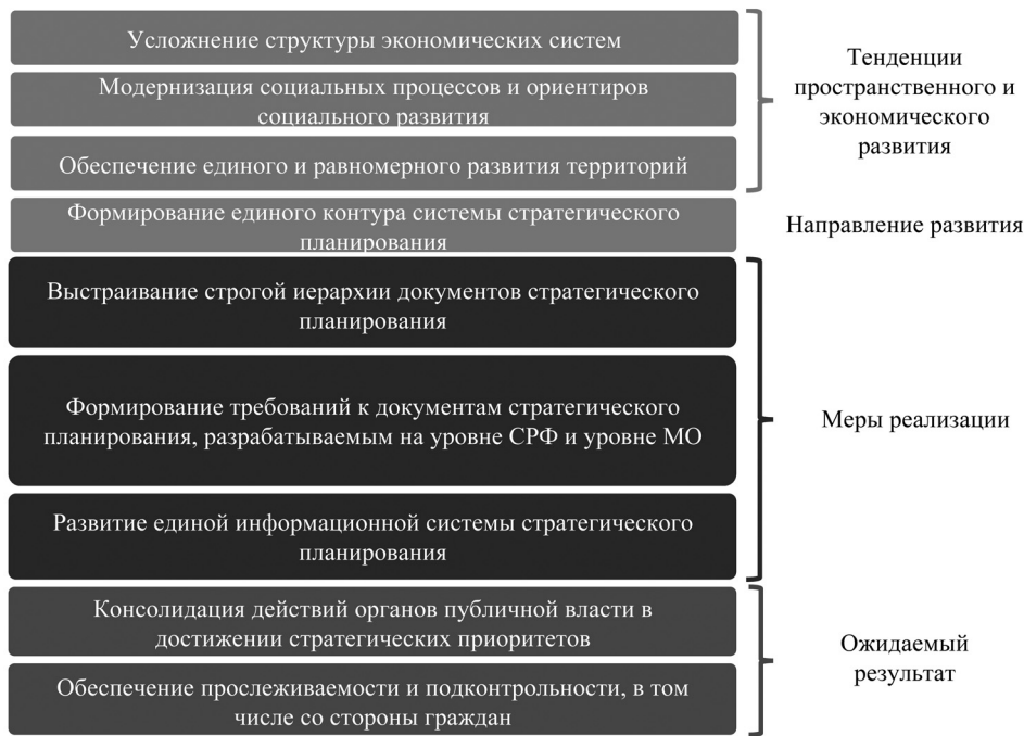
Рис. 5. Формирование единого контура системы стратегического планирования