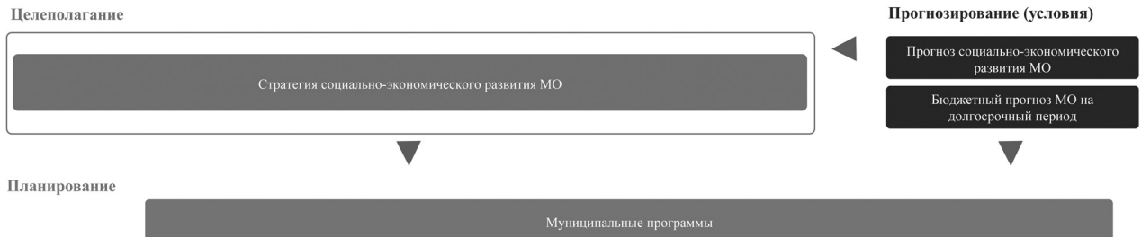
Рис. 3. Целевая модель системы управления развитием на муниципальном уровне