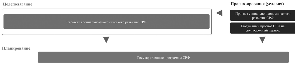
Рис. 2. Целевая модель системы управления развитием на региональном уровне