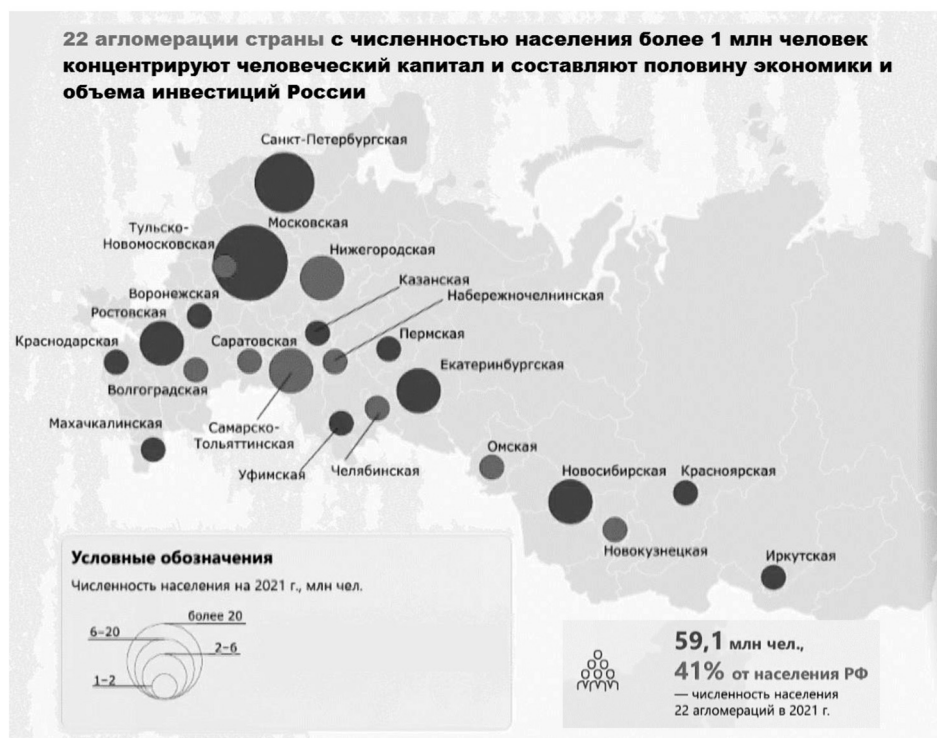
Рис. 1. Карта численности населения 22 агломераций и динамики его изменения (за период 2017-2021 гг.)

Источник: расчеты Центра стратегических разработок по данным базы данных показателей муниципальных образований Росстат, административным данным (Государственный информационный ресурс бухгалтерской отчетности)