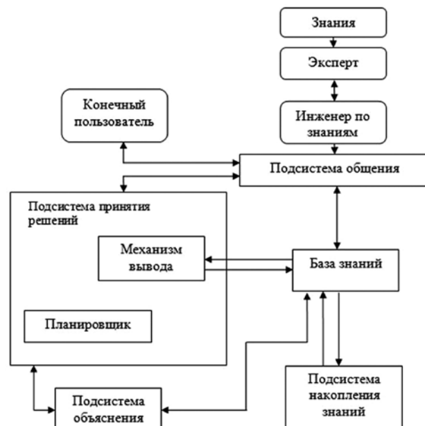
Рис. 1. Общая структура ИСД на базе экспертной системы

Инновационная система диагностирования (ИСД) может быть разработана на основе архитектуры экспертных систем [3] (рис. 1).