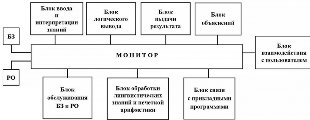
Рис. 2. Типовая архитектура ИСД на основе модели нечеткой системы

по результатам испытаний, могут быть дополнены экспертными оценками технического состояния с применением теории нечетких множеств. Теория нечетких множеств позволяет учитывать трудноформализуемые знания в виде опыта и интуиции лиц, принимающих решения.