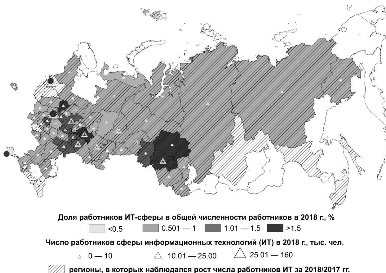
Рис. 2. География занятости в информационных технологиях в России

Выдвинутые нами гипотезы были подтверждены. Так, была выявлена стойкая положительная зависимость уровня занятости в сфере ИТ от возможностей