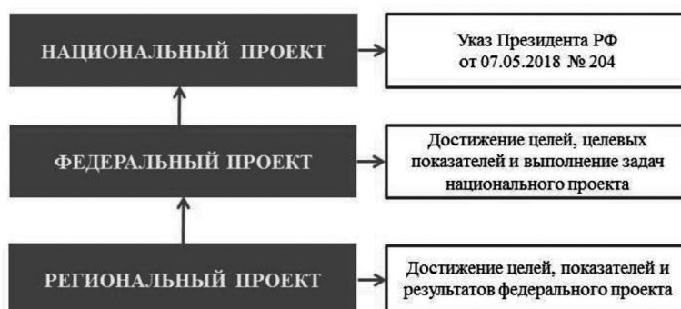
Рис. 1. Состав национальных проектов