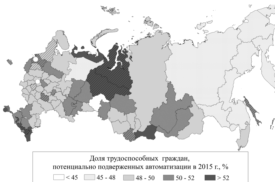
Рис. 3. Трудоспособные граждане, которые потенциально могут быть исключены из современной хозяйственной деятельности, в регионах России в 2015 г.

В России процесс автоматизации находится на начальной стадии, происходит постепенное изменение структуры занятости в сторону менее автоматизируемых отраслей [4], растет доля высокотехнологичных и наукоемких видов деятельности — более 33% работников в 2016 г. [2]. Скорость процессов автоматизации и внедрения цифровых технологий замедлена из-за экономических (высокая стоимость роботов в сравнении с рабочей силой), политических (страх социальных последствий), юридических (запрет на внедрение некоторых технологий) и иных ограничений. Эти факторы могли бы способствовать постепенной адаптации населения. Но современная модель рынка труда [3] тормозит реструктуризацию и модернизацию производств, усиливает неравенство среди занятых, лишает их социальной защиты и поддерживает неопределенность.