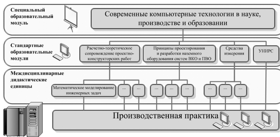
Рис. 2. Структура НРС-ориентированного учебно-методического комплекса

Разработанные преподавателями базовой кафедры «Средства ВКО и ПВО» учебно-методические материалы и рекомендации по использованию НРС-технологий могут применяться не только для обучения студентов целевого набора предприятий СЗРЦ. Коллективом кафедры запланирована разработка электронных учебных курсов, которые позволят сотрудникам предприятий СЗРЦ получить новые практические навыки и профессиональные знания в области НРС, необходимые для успешного выполнения вычислительно-емких расчетов в процессе реализации НИОКР [11].