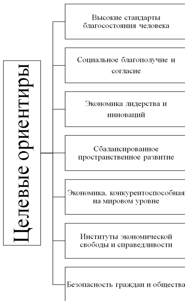
Рис. 1. Целевые ориентиры Концепции долгосрочного социально-экономического развития Российской Федерации на период до 2020 г.

[35], положенной в основу ныне действующих государственных программ [9], вопросам формирования инновационного развития российской экономики посвящено целое направление (рис. 1), то в вариантах стратегий развития национальной экономики МЭР, СК и ЦСР контуры инновационного развития просто не просматриваются.