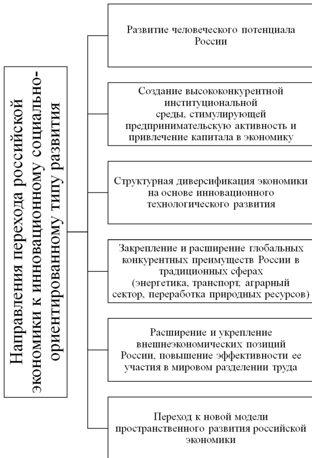
Рис. 2. Направления перехода к инновационному социально ориентированному типу экономического развития, изложенные в Концепции долгосрочного социально-экономического развития Российской Федерации на период до 2020 г.

Да и анализируя выполнение действующих госпрограмм, эксперты справедливо отмечают, что оценка эффективности их выполнения определяется главным образом процентом освоения выделенных бюджетных средств [47].