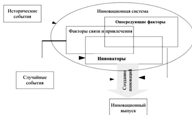
Рис. 2. Взаимодействия детерминант инновационной системы

При эмпирической проверке гипотез модели Ц. Грилихеса возникает ряд сложностей. Инновационный процесс требует времени на создание, выпуск и адаптацию, вследствие чего текущие исследования могут оказать влияние на выпуск лишь спустя несколько лет, это требует точной спецификации