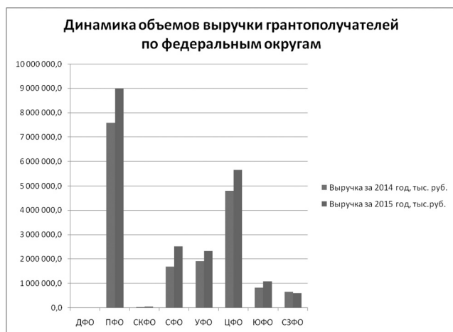
Рис. 3. График динамики объемов выручки по федеральным округам

Структура поданных заявок по федеральным округам представлена на рис. 1. Всего по программе «Коммерциализация» в 2014-2015 гг. заключено 434 контракта на общую сумму 3,8 млрд руб. Топ-10 регионов-лидеров по объему полученной в рамках программы поддержки представлены на рис. 2.