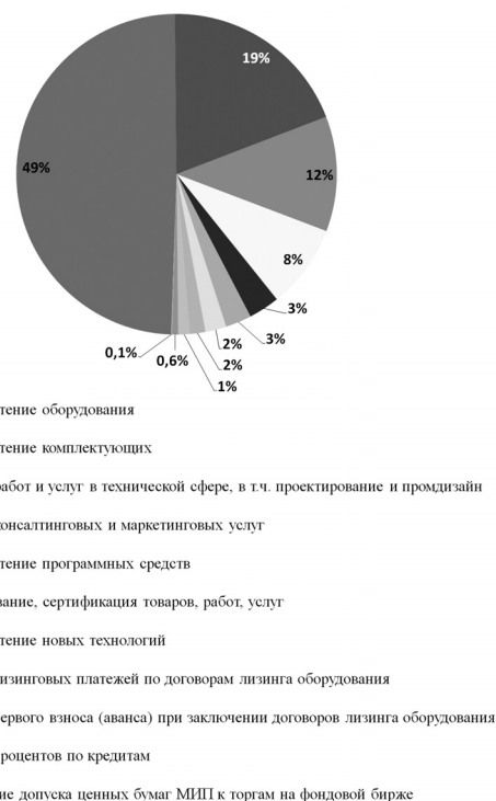
Рис. 4. Сводная диаграмма с распределением средств по статьям затрат

Среди компаний, получивших поддержку Фонда, ряд предприятий — успешные экспортеры российской продукции: ОАО «НПО Стример» (Санкт-Петербург), разработчик систем безопасности ООО «АСХ» (Санкт-Петербург), производитель высокоскоростных гигабитных систем радиосвязи и высокочастотных измерительных приборов ООО «ДОК» (Санкт-Петербург), материалов, инструментов и оборудования для стоматологии ЗАО «ОЭЗ «ВладМиВа» (Белгород), проектировщик решений задач контроля на объектах энергетической промышленности ООО «ЭМА-диагностика» (Санкт-Петербург), разработчик компьютерных и суперкомпьютерных технологий ООО Лаборатория «Вычислительная механика» (Санкт-Петербург), производитель фторированных соединений ООО «НВФ «Окта» (Пермь), разработчик термоэлектрических устройств ООО «Завод «Кри-