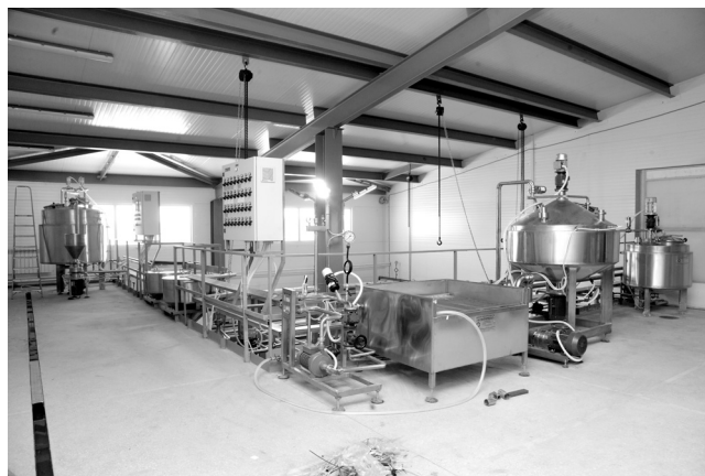
Новая линия для производства начинок

В 2014 г. томичи вели переговоры о поставке нового оборудования с одной из голландских фирм, но ситуация с резко подорожавшей валютой заставила изменить планы. В итоге решено было заказать современное высокопроизводительное оборудование в