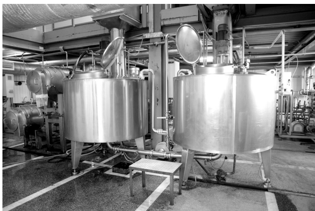
Линия для переработки облепихи

Производится кондитерская и молочная продукция на автоматических линиях, поэтому физико-химические показатели всех ингредиентов должны четко соответствовать заданным параметрам, иначе