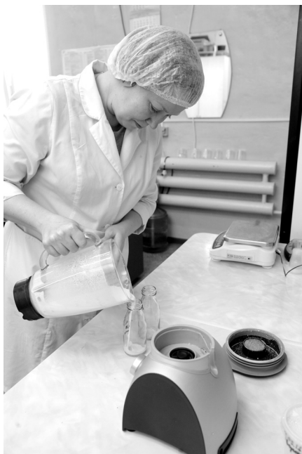
Научно производственный отдел (НПО)

позволяет достичь высокого уровня производительности и получить доступный по цене инновационный продукт. Есть в планах предприятия и травяные чаи, в частности, на основе популярного сегодня иван-чая.