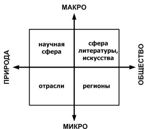
Рис. 2. Интеллектуальное пространство самовыражения творческих деятелей

системно охватывающего всю зону самовыражения творческих деятелей, работающих на нашу и любую национальную экономику.