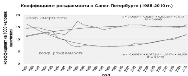
Рис. 2. Демография в Санкт-Петербурге

циацией «Ленплодоовощ» для практической реализации Доктрины продбезопасности, восстановления производства во всех сельхозпредприятиях города и области. Создать ассоциации, подобные «Ленплодоовощ», во всех отраслях ЛенАПК.