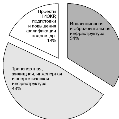
Рис. 3. Запланированные направления использования средств из федерального бюджета 2013–2017 гг. [1]

Для того чтобы российские кластерные инициативы стали, согласно определению, инструментом повышения конкурентоспособности участников кластера, а не очередным способом получения государственных льгот, необходимо основательно пересмотреть подходы к обнаружению, поддержке и мониторингу российских кластеров. Однако основная задача в России должна состоять не столько в попытках адаптации зарубежных институтов в отдельных инновацион-