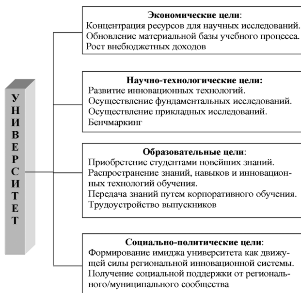
Рис. 2. Цели университета в процессе спин-офф

2. Экономическая эффективность спин-офф определяется соотношением результатов (доходов), полученных университетом от деятельности компаний спин-офф и затрат университета на их создание и поддержку. Если для этих целей университет создает бизнес-инкубатор, то экономическая эффективность процесса спин-офф определяется эффективностью бизнес-инкубатора.