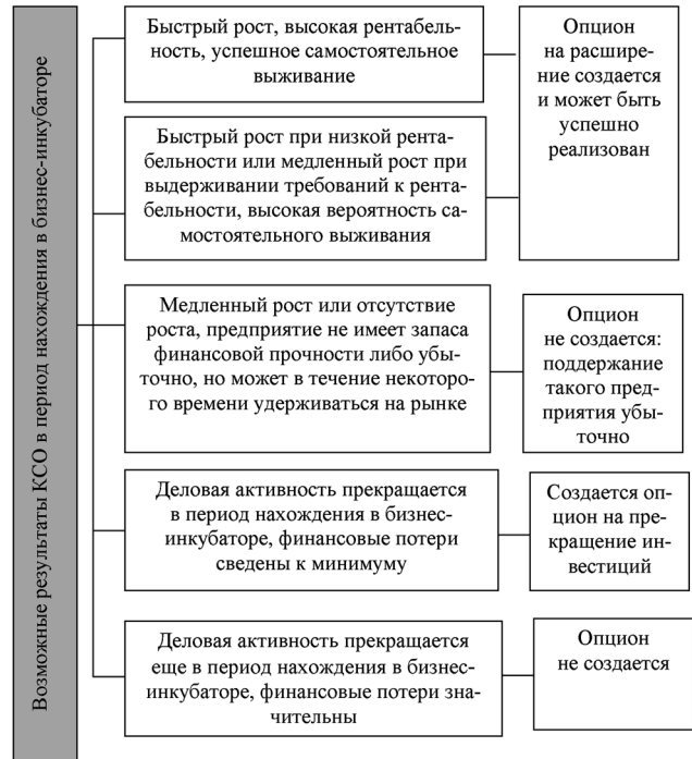
Рис. 3. Результаты деятельности бизнес-инкубатора по отношению к компаниям спин-офф с точки зрения теории реальных опционов

привлекаемых ресурсов бизнес-инкубатора и качество управления ими.