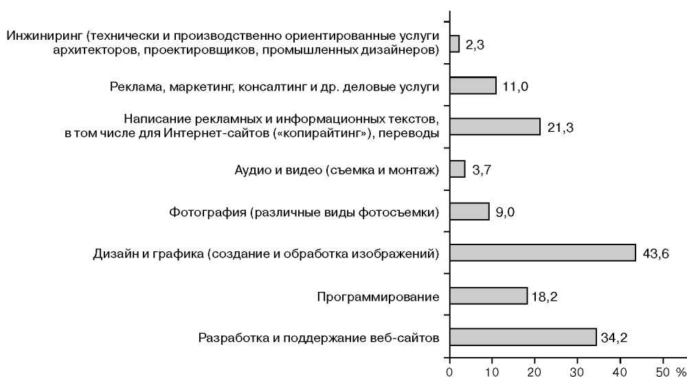
Рис. 3. Профессиональная структура фрилансеров

Что касается фрилансеров из Молдовы, то, данные табл. 1, свидетельствуют о том, что респонденты составили 1,3% от всех опрошенных. Данная форма занятости распространена в стране, однако подтвердить это эмпирически не представляется возможным, поскольку на сегодняшний день исследования по данной тематике в самой республике не проводились.