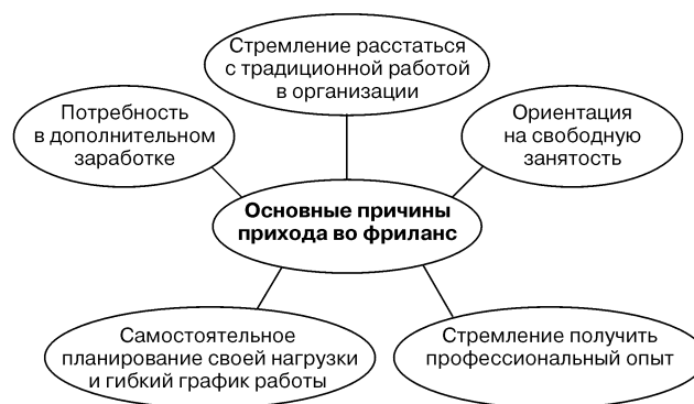
Рис. 1. Основные причины прихода во фриланс

С начала 1990-х гг. все бывшие союзные республики переживали период развития, характеризующийся трансформацией социально-экономической сферы общества. Происходящие перемены привели к существенному изменению ситуации на рынке труда. Из государственных организаций «вышла» армия оставшихся без работы специалистов, произошло абсолютное и относительное сокращение численности занятости в экономике, а также изменилась отраслевая структура занятости, в которой увеличилась доля сектора услуг, официально утвердилось такое понятие как безработица. В условиях падения спроса на рабочую силу, фриланс, как одна из форм нетрадиционной занятости, нередко становится для мужчин и женщин единственной возможностью обеспечить себе материальный доход и своеобразной альтернативой традиционной занятости. Существуют объективные и субъективные факторы, оказывающие влияние на мотивы работников перехода во фриланс: социально-экономическая ситуация в стране, система трудоустройства, требования рынка труда и занятости с одной стороны и степень удовлетворенности работников своим трудом с другой стороны. Основные причины прихода людей во фриланс сгруппированы и представлены на рис. 1: