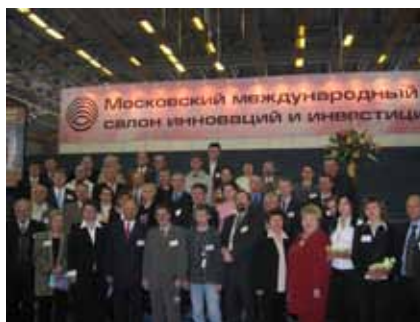
Фото 8. Делегация Ставропольского края.

При этом важным является то, что государство через программы Фонда содействия дает возможность молодежи создавать наукоемкие производства в России, а не уезжать за рубеж в поисках «силиконовых долин». И в том, что наука на Ставрополье из года в год молодеет, во многом связано с активным участием ставропольских студентов и аспирантов в программах Фонда содействия «УМНИК» и «УМНИК на СТАРТ», ориентированными исключительно на поддержку научной молодежи. Уже более 280 молодых и талантливых студентов и аспирантов Ставрополья получили гранты в рамках программы «УМНИК».