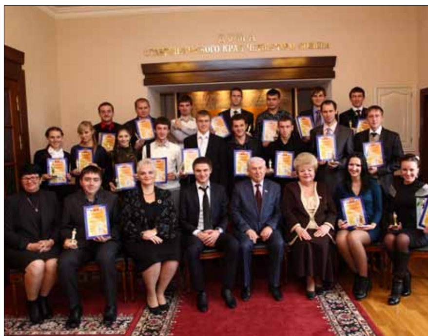
Фото 10. Победители Программы «УМНИК» в Думе Ставропольского края.

получили 136 грантов. Еще 4 гранта получили ставропольские общественные организации.