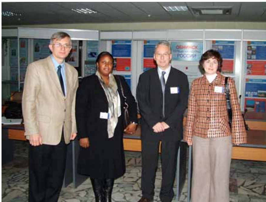
Фото 9. Обмен опытом специалистов ИТЦ Ставропольского края с международными экспертами А.Бреттом (США) и Д.Кейс (Великобритания)

Фонд грантового конкурса не имеет аналогов в Европе и составляет 100 млн рублей. Любой молодой человек, постоянно проживающий на территории СКФО, в составе делегации от субъекта РФ, мог представить свой инновационный проект экспертному совету и «выиграть» грант на его реализацию в размере от 100 до 500 тысяч рублей. Среди тех, кто проводил тренинги и мастер-классы на «Машуке» много победителей конкурсных программ Фонда содействия «УМНИК» и «СТАРТ», которые поделились своим опытом разработки и реализации инновационных проектов. Не случайно молодые ставропольские авторы проектов