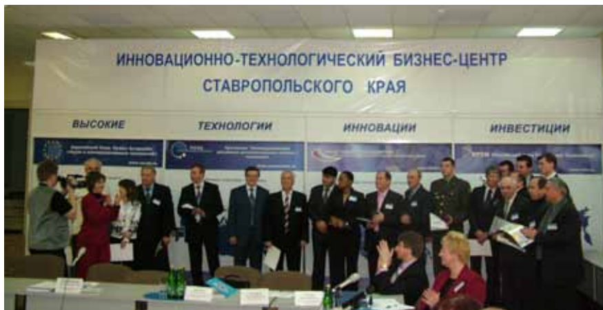
Фото 1. Участники Недели Инноваций и Инвестиций на Ставрополье.

На базе ИТЦ Ставропольского края ежегодно проводятся телеконфе-