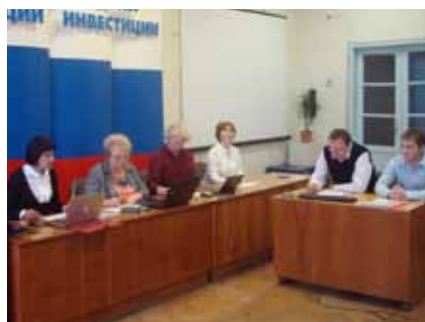
Фото 2. Участники телеконференции по защите инновационных проектов конкурсной программы «СТАРТ».

Благодаря слаженной работе научной общественности и органов государственной власти в крае растет число тех малых инновационных предприятий, которые уже завершают третий год финансирования Фондом, а значит, выполнив условия программы