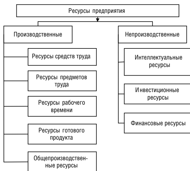
Рис. 1. Типология ресурсов предприятия

Неиспользованные и постоянно возникающие возможности роста и совершенствования производства, улучшения его конечных результатов (увеличения выпуска и реализации продукции, снижения ее себестоимости, роста прибыли (дохода)) являются внутренними производственными ресурсами промышленного предприятия (рис. 1).